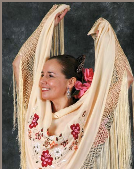
Latin Ballet of Virginia

O estado irmão de Virgínia no Brasil é Santa Catarina