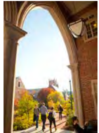
University of Richmond