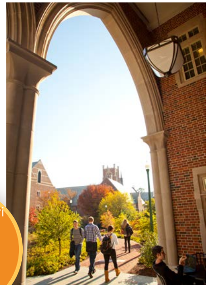
University of Richmond

"Le 10 migliori città per il commercio globale" - Global Trade Magazine, 2016