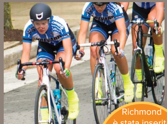
Campionato Mondiale di Ciclismo 2015

Richmond è stata inserita tra le migliori città americane di media grandezza del futuro per il 2019/20 - da fdi Intelligence, 2019